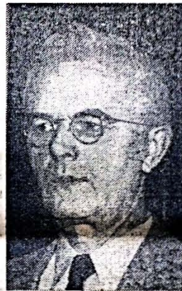
Dr. Herschel T. Manuel

Entre los motivos de su viaje a Puerto Rico figura el deseo de hacer entrega, al Consejo Superior de Enseñanza y al Departamento de Instrucción, del informe sobre un experimento llevado a cabo en Puerto Rico, México y los estados del suroeste de la Unión, por el Consejo de Educación de Estados Unidos, acerca del aprendizaje del inglés y el español.