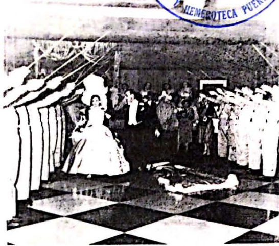
Grupo de cadetes que, como Escolta de Honor, rindió honores a la Reina del Carnaval en el día de su coronación.