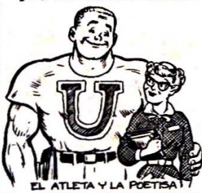
EL ATLETA Y LA POETISA

... Y HABLANDO DE AMORES Y NOVIAZGOS (¿LEGS LA PRIMAVERA?)... ¿HAN VISTO USTEDES CÓMO DIOS LOS HACE Y CUPIDO (DIABULO TRAVEZO) LOS JUNTA?