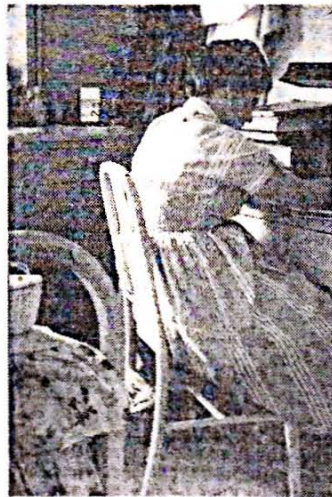
Otra Srta. entregada a la meditación.

En un cotejo sincero de la realidad tenemos que decir que el Carlota Matienzo, institución inaugurada en 1927, es el sitio ideal para que las señoritas estudien y vivan en un verdadero ambiente de familia y en una sana proyección de sus hogares.