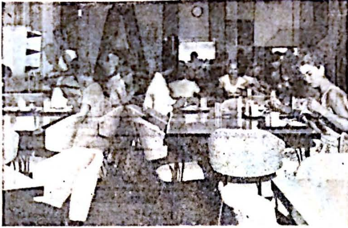
Vista interior del moderno comedor de la Residencia Carlota Matienzo.

La situación, de hecho, es clara. Si queremos velar por los valores básicos de nuestra sociedad y de sus componentes, si queremos ayudar a la sabia (Pasa a la página 7)