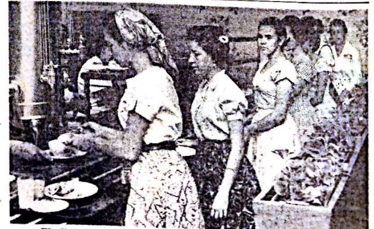
El eficiente y ordenado sistema de los turnos en las comidas.