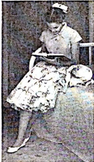
Una de las señoritas repasa su lección antes de la clase.

Como la directora se había quedado abajo, nuestras guías aprovecharon la oportunidad para relatarnos algunas confidencias sobre su interesante vida en la Residencia. Nos contaron que durante las horas libres se entretienen a veces en hacerles ciertas maldades a sus compañeras. Como por ejemplo, aprovechar la oportunidad que la compañera ha salido, ponerle todas sus pertenencias en las maletas y colocarlas en las puertas, como cuando no pagamos una casa de alquiler y nos des-