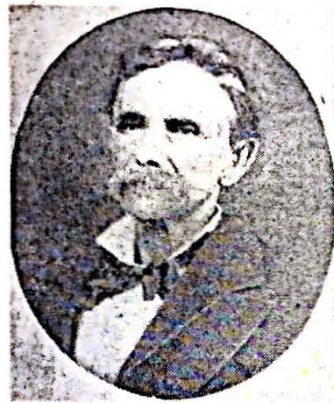
Román Baldorioty de Castro

A pesar de que su labor literaria no fue fecunda, en sus artículos, folletos y libros abarca todas las cuestiones: política, historia, literatura, ciencias físicas y matemáticas, mecánica, agricultura, pedagogía, sociología, moral,