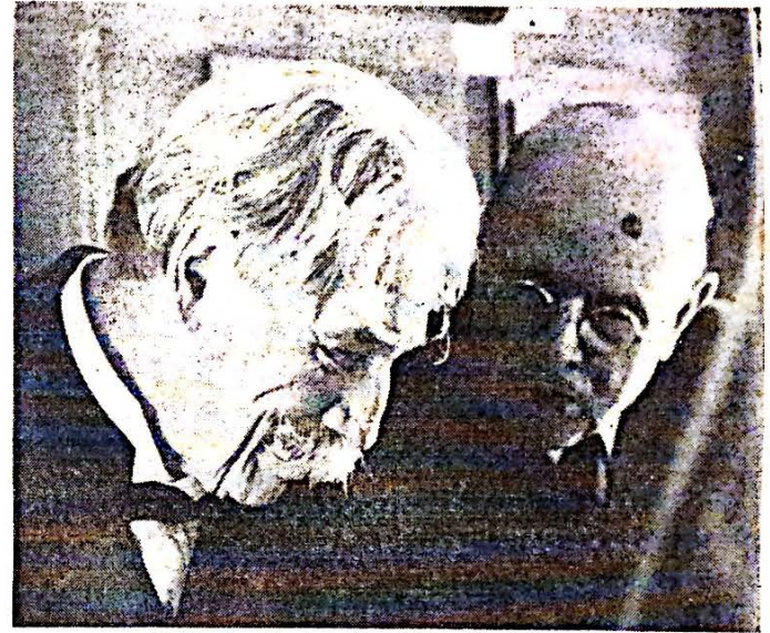
El Maestro Casals y el pacifista Albert Schweitzer.