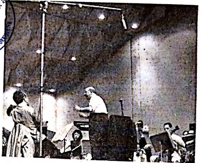
Don Pablo Casals mientras dirigía la orquesta momentos antes de sufrir la afección cardíaca durante los ensayos para el Festival Casals.

Prestigiosos estudiantes de nuestro mundo intelectual asisten a él como el