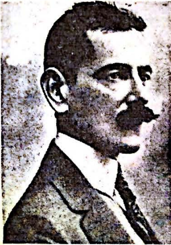
José de Diego. El Caballero de la Raza

De la liquidación final del siglo XIX emergieron a nuestro siglo figuras de excelsa magnitud que ennoblecieron los ideales, viviendo a la altura de ellos. Figura destacadísima de entre estos lo fue Don José de Diego y Martínez, símbolo de un ideal hecho flecha hacia la más alta esfera de nuestra libertad. Encarnación latente del espíritu de la cultura hispánica. Celoso guardián de nuestros supremos valores en sus horas más críticas y amargas.