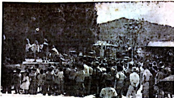
"Sancho Panza en la Insula Barataria" una de las primeras funciones del Teatro Rodante en sus presentaciones a través de toda la Isla.

En 1931 y en su capacidad de Secretario General de la Universidad de Chile, fundó y organizó el Departamento de Bienestar Estudiantil e Imprenta de la Universidad. Ocupó el cargo de Ministro de Educación Pública en 1953. Es miembro de la Academia Chilena de Historia.