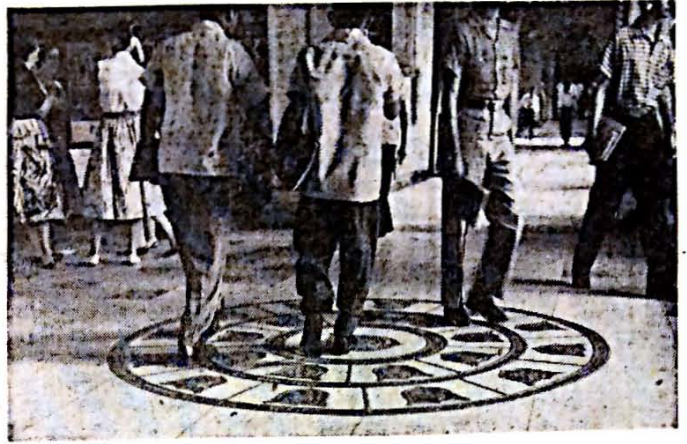
¡Cosas que parten el alma...!