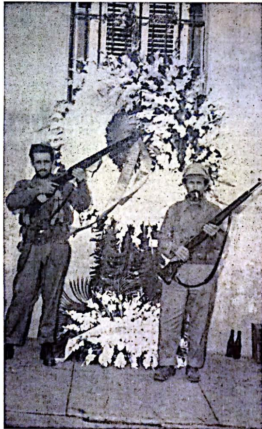
En este lugar, Calle Jovellar, cayó José A. Echevarría, Presidente de la Federación Estudiantil Universitaria (F.E.U.) de la Universidad de la Habana. Los soldados de Batista lo cosieron a balazos.