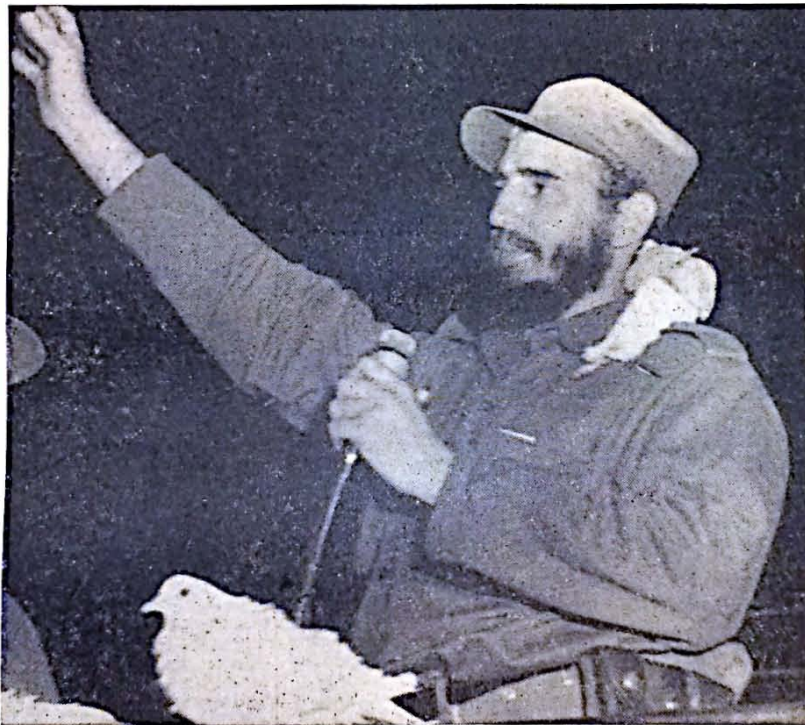
DOCTOR FIDEL CASTRO RUZ Figura Cumbre del Movimiento Revolucionario 26 de Julio.

El periódico UNIVERSIDAD dedica esta edición en homenaje de simpatía a los gloriosos héroes de la Revolución.