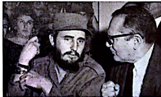
Por fin, Fidel llega en el palacio presidencial donde días antes el criminal Fulgencio Batista despachaba órdenes de arresto, encarcelamiento, y de asesinar el pueblo cubano. Aquí aparece Fidel en conversación con el presidente Manuel Urrutia.