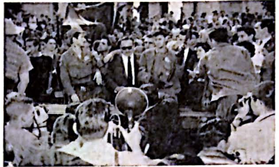
La llegada del presidente Manuel Urrutia a la Universidad de La Habana después de la fuga de Batista. Miles de universitarios le ovacionaron.