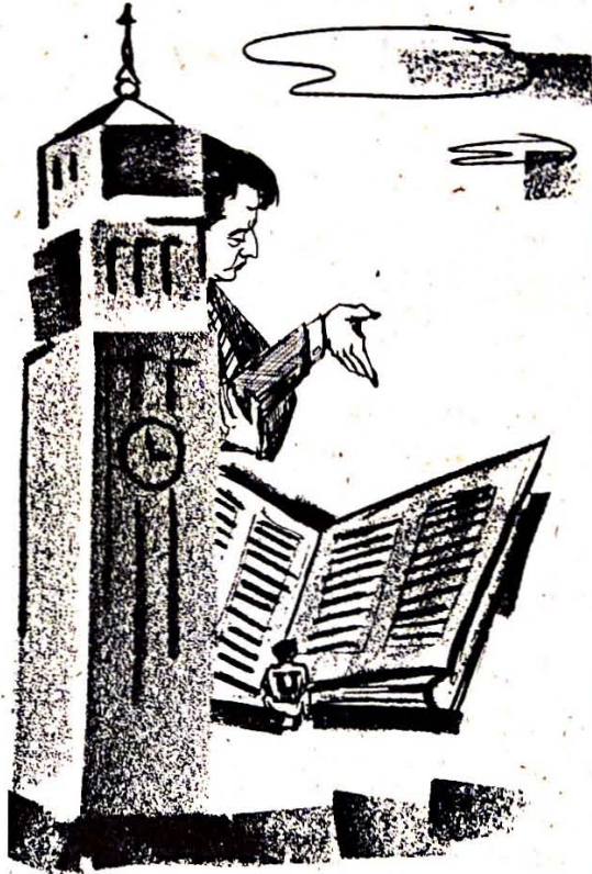
Calladito — Calladito — sin protestar

Señalar una crisis en la escala de valores universitaria, implica un análisis decidido de esa crisis, desde su raíz misma. Considerar al estudiante como un individuo incapacitado intelectualmente para enfrentarse al mundo de ideas que le ofrece la Universidad, es afirmar una gran falla que va corrompiendo nuestra sociedad y que parte del medio circundante en que el estudiante se mueve. Es un choque violento en los valores. Por un lado se exhorta la búsqueda de la esencia del hombre, se sugiere que el estudiante se dirija hacia la meditación, se trata de encender la llama del conocimiento por conocimiento, por verdad y por realidad y por otro lado se le impone un curso donde se estudia el radio de dispersión de una bomba, número de bajas en ese radio y análisis de estadísticas sobre muertes en la segunda guerra mundial. Decididamente algo muy serio está fallando. La frase de Hamlet del ser o no ser se transforma aquí en un lamentable ser y no ser. Todo se limita a discursos bien arreglados de la llamada misión de la Universidad. Pero en la práctica se estrella el hermoso y florido léxico. No pueden forjarse mentes libres cuando van atadas a datos sobre la ruina humana. No pueden moldearse caracteres cuando se va especulando sobre el dolor ajeno y se señala como creación meritoria del hombre el número de bajas en una guerra mundial.