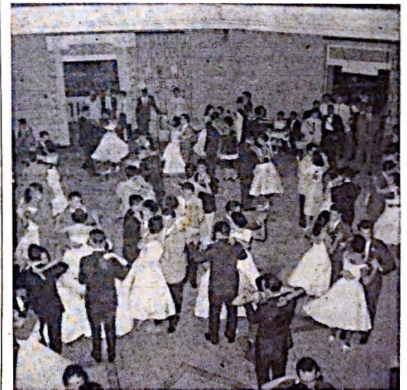
Un aspecto del baile de "White Christmas" que celebró el pensionado.

Las chicas del pensionado Isabel Andréu de Aguilar celebraron un baile de White Christmas para finalizar sus actividades del pasado semestre. En este baile, era requisito para toda joven de llevar un traje blanco.