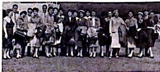
El grupo de estudiantes y profesores de la U. P. R. que participó en el viaje de estudios a Méjico de diciembre pasado.