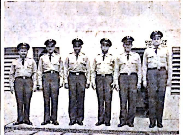
Un grupo de guardias de la U. P. R. vestidos con sus nuevos uniformes.

El año 1959 ha traído varios cambios en nuestros campus. Uno de ellos es el nuevo uniforme de la policía universitaria. Actualmente los guardias de la Universidad llevan un pantalón azul, una camisa gris y una gorra azul con insignia de la U. P. R. Este periódico quiere enfatizar número de policías con que cuenta la Universidad siguen ocurriendo numerosos abusos. Sabemos que esto podría evitarse.